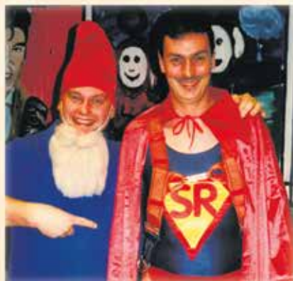
Charlie Chaplin am Scheinwerfer. Die Mainzelmännchen als Kulissenschieber und eine Cola-Dose mit zwei hübschen